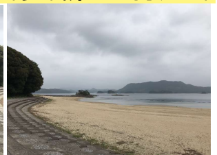
■すぐそばの高台にはいろは島が一望に臨める展望台があります!曇り空でしたがちょうどよい心地の日でした ■軽快な走りのHONDA FIT