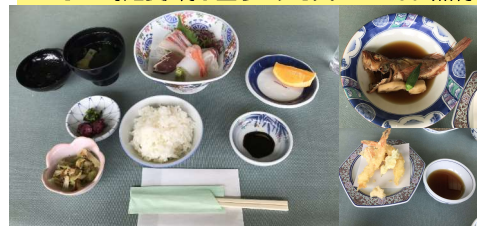
■いろは島定食/刺し盛り・げそ天・アラカブ煮付け1,980円 ■無料の駐車場から歩いていくと「花と冒険の島」があります。海がとてもきれいです!

梅雨の間に晴れ間がのぞいていた第二日曜日、「近くであじさいが咲いているところはある?」の父の話から、「佐賀の見返りの滝があじさい祭りやってると思うよ!」と言うことで、お昼前から家を出て、唐津方面へ出発。呼子のイカ定食は高いので、「いろは島の国民宿舎が安くて美味しいよ!」とお昼をいろは島でとることにしました。先週父が最後の乗用車と言って買った中古のHONDA Fitで、大人4人(うち重量級3人)と犬たち連れて、西九州道から肥前町方面に向かいました。走り始めて1時間少して、ほとんど渋滞もなく、いろは島が見えてきました。今回で二回目ですが、ここは超穴場!いつもほとんど人がいなくて、きれいな砂浜を犬たちは大はしゃぎで走り回り、そのあとの我々の食事の時は、おとなしく車で待っててくれました。1980円のいろは島定食は絶対おすすめです!国民宿舎のそばから、展望台へ登る道があり、車で行きました。iPhoneで撮ったパノラマ写真をご覧ください!